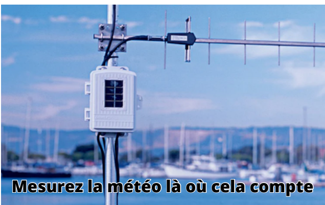
Mesurez la météo là où cela compte

Basé à Hayward, en Californie, Davis Instruments est un fabricant et développeur privé d'instruments météorologiques, marins et automobiles exceptionnels. Davis Instruments est fier de son innovation et de ses produits conviviaux de haute qualité à des prix raisonnables pour tous, des observateurs météorologiques aux scientifiques.